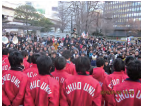
惨敗に再起を誓う関係者(大手町の会場にて)