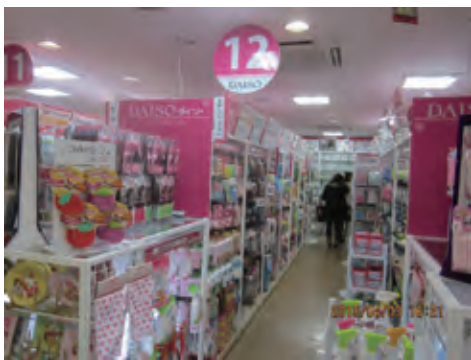
ダイソーメトロ・エム後楽園店

円。また、B4コピーが一枚五円のセルフコピー機も設置されている。レジの対応も心地よく、足を踏み入れたことのない人には、非常に面白い空間だ。