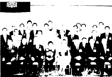
平成10年の新年会(文京シビックセンター・スカイホール)