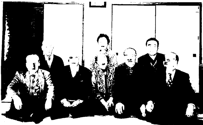
花の雲……名句が浮かびましたか? 「俳句同好会」