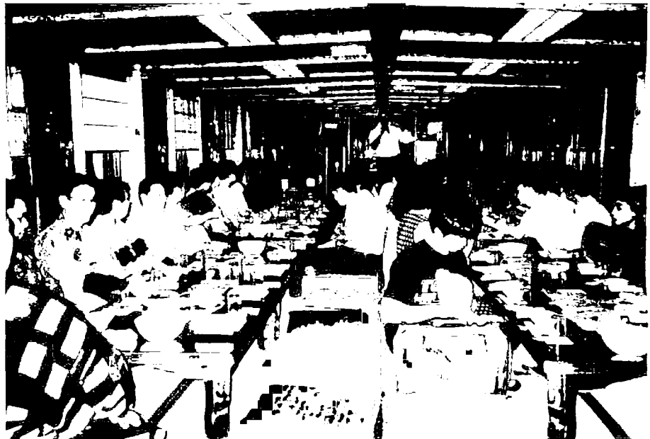
吹けよ川風、出港間近「納涼屋形船」