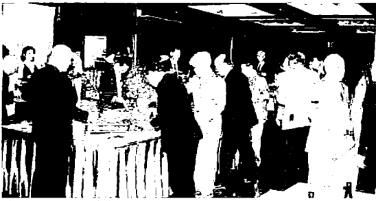
山海の珍味が盛り沢山