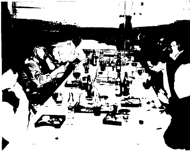
「ゴルフ会」の面々 次回第5回(今秋予定)には たくさんの参加をお待ちしております