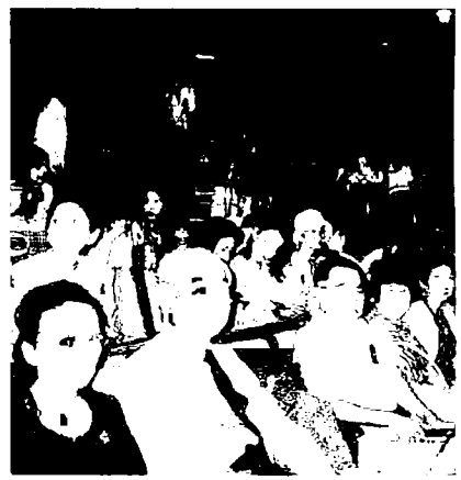
芸術を愛でる歓び——ロシアンバレエ鑑賞——東京文化会館「観