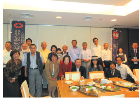
一攫千金の夢破れた紳士淑女

今年もやって来ました大井競馬場の納涼の夕べ。一部ののんべえ集団にはうってつけの企画だ。普段は馬主さんがネクタイで入る競馬場東ウイング五階特別貴賓室である。真下に広がる競馬場大パノラマをツマミに生ビール飲み放題、料理食べ放題の豪気な企画、勿論会費制だが。