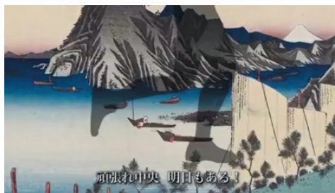
走れ獅子の如く【作詩:赤池みつを 作曲:いとうようこ 歌:白門グリークラブ】

白門グリークラブがCD化したのが、平成二十九年のホームカミングデーで突然披露されて、メジャーになった。全国の白門学員が『惜別の歌』同様に愛唱してくればいい。昨年、YOUTUBEに配信し、カウント上昇中。(「走れ獅子の如く」で検索) (昭42年商経卒・日本作詞家協会会員)