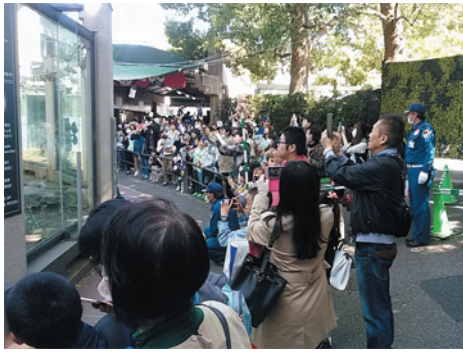
眠ったパンダを熱心に見学

白門文京の紳士・淑女は夫々に上野の山の自由散策を経て、花より団子会は、築地のマグロ大王木村清社長の「上野すしざんまい」に集結。社長差し入れの「豪華船盛り」で舌鼓、パンダ桜会は大満腹で散会した。