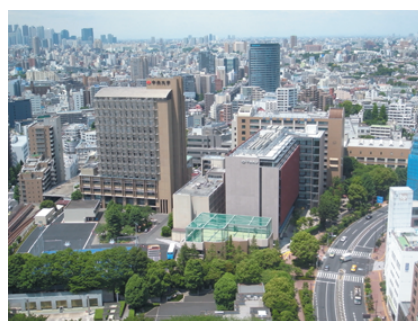
文京区・後樂園キャンパス

今年が多摩移転四〇年の区切りの年ですが、まさに多摩移転以来と言うべき、「One Vision2026」に謳う大改革によって、中央大学は今生まれ変わり、飛躍の時を迎えようとしています。文京区支部の皆さま方におかれましては、こうした本学の現状についてご理解を賜りますとともに、併せて従前同様の変わらぬご支援、ご鞭撻のほどお願い申し上げます。