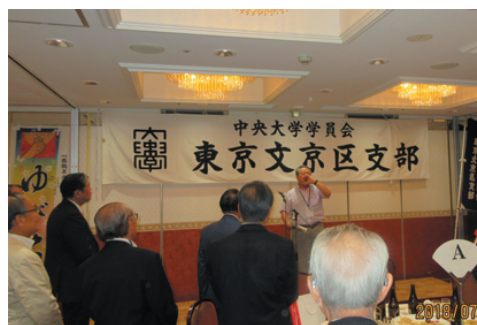
文京区支部懇親会で華麗な指笛を披露

の心配をしないで呼んで下さい。そして一緒に楽しみましよう。 一生、順風満帆な人生を送れる人は稀です。誰にでも波乱万丈はある。いかなる時も音楽は人を癒してくれる。指一本でそれができる。「人生楽しんで勝者」……今年筑波大一年生になった全盲青年のことばです。 (昭42年経卒)